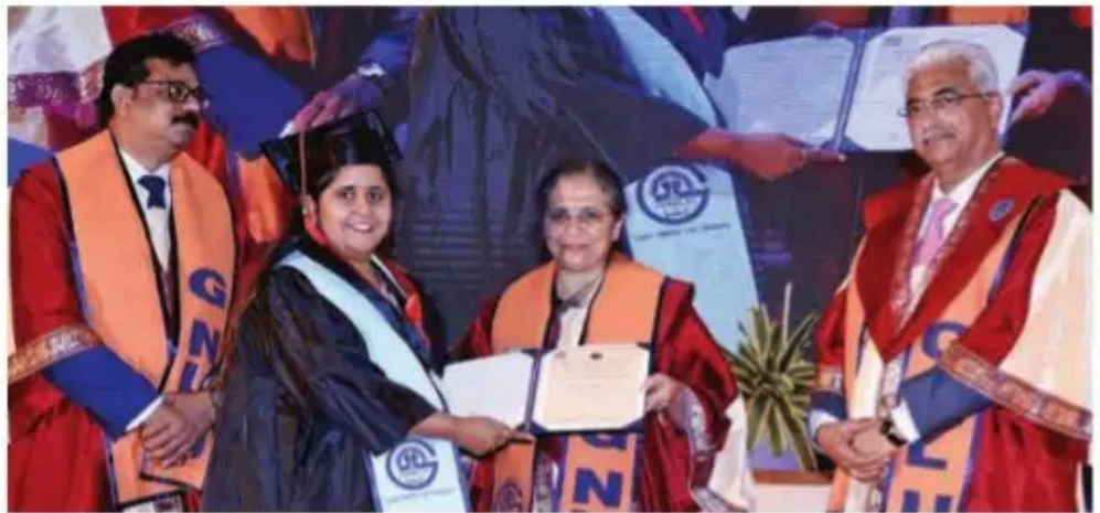
Justice Bela Trivedi (centre) hands over degrees with Justice Kumar (R)

"As lawyers, your duty is to serve justice, not always to profit, but to serve truth with courage...Your flaws, your cracks, your vulnerability make